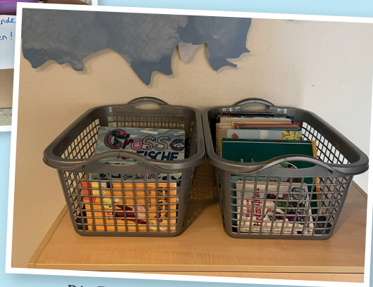
Die Bücherkisten füllt die Kita regelmäßig wieder auf!